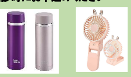
ステンレス水筒 300ml ハンディファン

1年後再受診し事後アンケートを提出いただいた方には ・ステンレス水筒(1本) ・ハンディファン プレゼント!