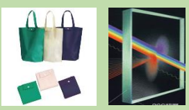
エコバック 小窓用お直し遮熱シート

受診3ヶ月後の事後アンケートを提出いただいた方には ・エコバック(1枚) ・小窓用遮熱シート プレゼント!