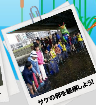
サケの卵を観察しよう！