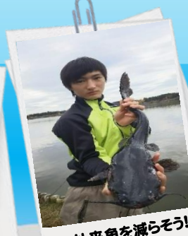
外来魚を減らそう！