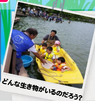
どんな生き物がいるのだろう？

学習テーマに合わせて、あみ、虫かご、水質検査キットなどをお配りします。また、協賛企業提供の飲み物や文具の配布などもあります。