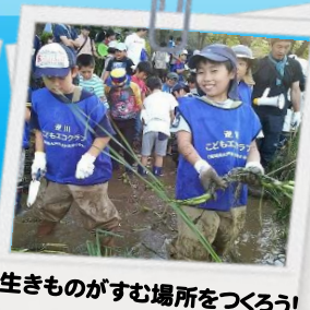
生きものがすむ場所をつくろう！