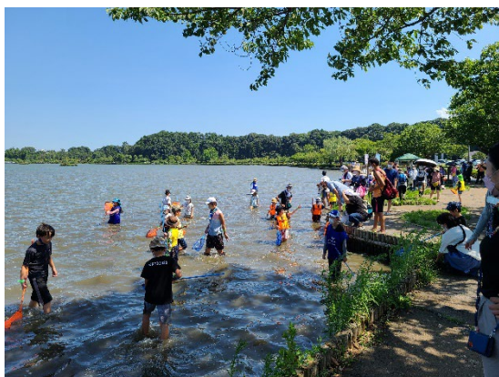
間隔をあけて魚類等を採取する子どもたち

※ 千波湖の西側（放流橋から西側）は、通常、生物類の採取や魚釣りが禁止されていますが、特別な許可により、本学習会では実際に千波湖に入って生物を採取することができます。