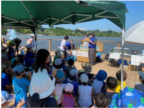
魚に関するクイズ