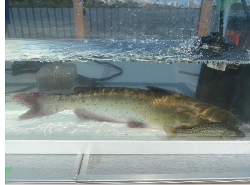
採取されたアメリカナマズ

子どもたちが採ってきた魚については、数種類をピックアップして水槽に入れ、皆で観察しました。採れた魚の生態等について講師から説明があり、そのほかにクイズ形式で子どもたちに質問をし、魚の外来種についての学習も行いました。