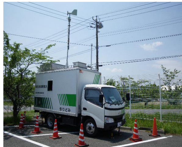
大気環境、気象観測測定車 みどり号